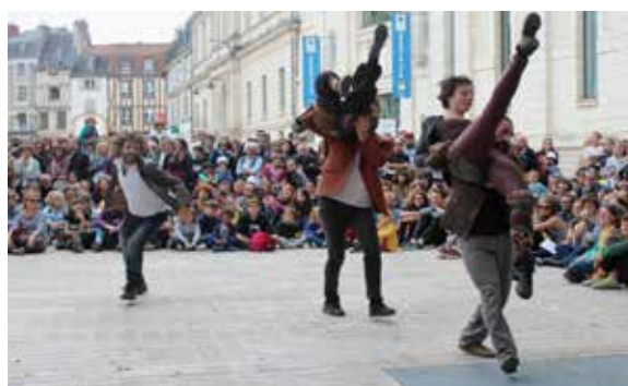
Je cherche un Homme 2018

12 rue Alphonse Baudin - 17000 La Rochelle