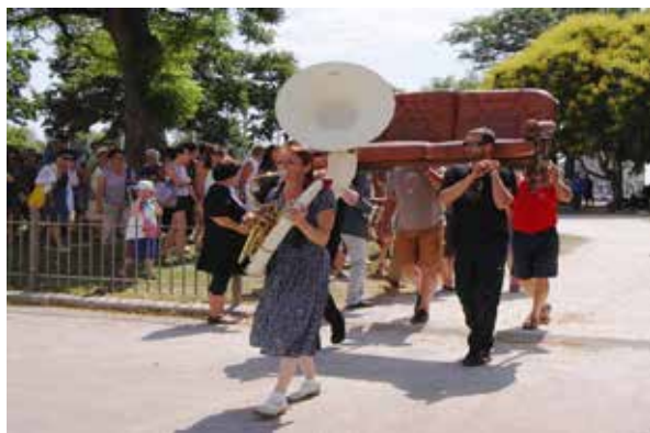
Le cimetière itinérant de canapés 2009 - 2010

Pour l'autrice, c'est une nouvelle façon d'écrire qui répond à la nécessité de cette création.