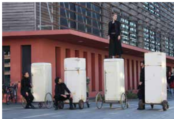
10.000 pas sans amour 2015