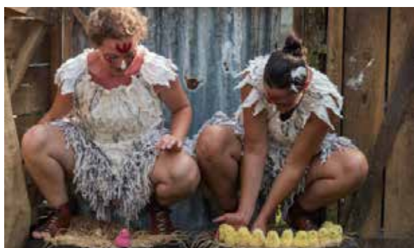
Poulette Crevette 2016