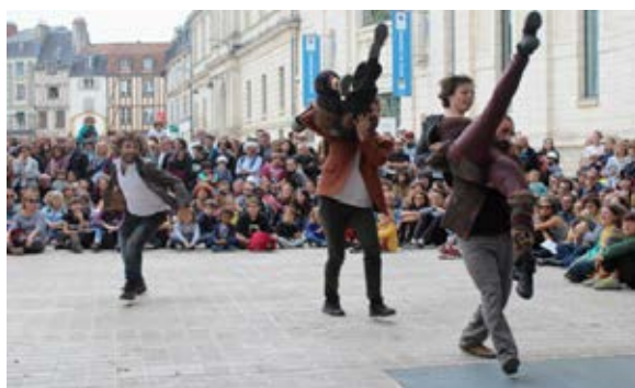
Je cherche un Homme 2018