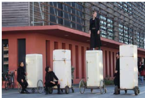
10.000 pas sans amour 2015