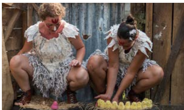
Poulette Crevette 2016