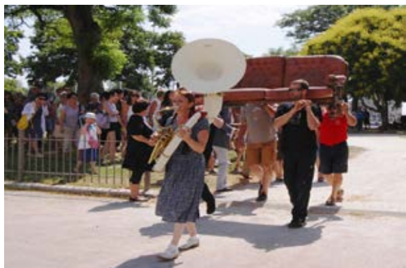
Le cimetière itinérant de canapés 2009 - 2010

Pour l'autrice, c'est une nouvelle façon d'écrire qui répond à la nécessité de cette création.